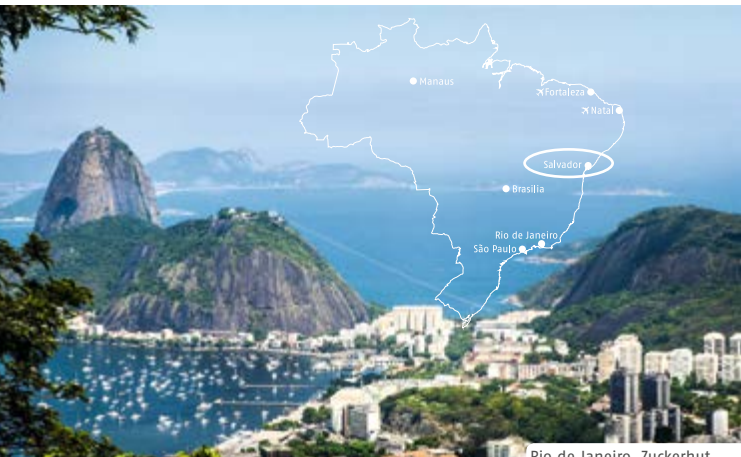
Rio de Janeiro, Zuckerhut